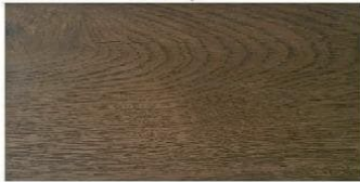
MEDIUM OAK - średni dąb