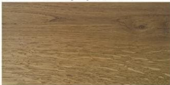
LIGHT VICTORIAN - jasny wiktoriański