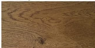
TEAK - tekowy