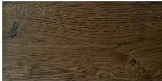
HONEY - miodowy