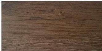
MAHOGANY - mahoniowy