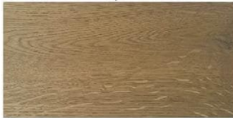
KENILWORTH OAK - dąb z Kenilworth