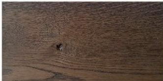
WALNUT - orzech