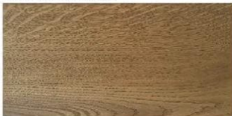
LIGHT OAK - jasny dąb